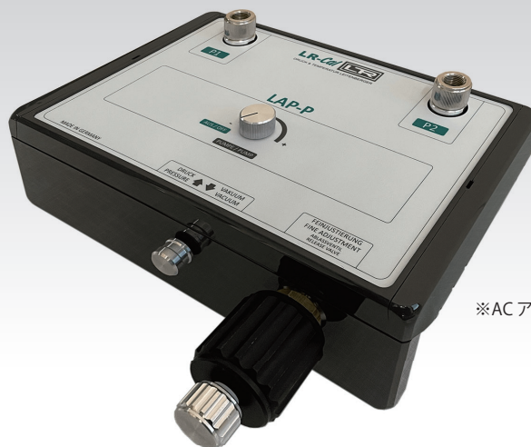
電動・空気圧式 テストポンプ