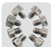
クイック継手 1 (1/8", 1/4", 3/8", 1/2" BSPT/BSPP & NPT メス セット)