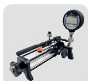
デジタル基準圧力計 PDR1000 0.025% PDR500 0.1% PDR250 0.25%