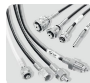
フレキシブルチューブ