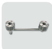
External pressure manifold