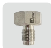
Quick adaptor 3 高圧 9/16" UNF F Cone Threaded