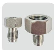
クイック継手 2 M14 x 1.5, M20 x 1.5 メス 2個