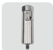
Liquid to Liquid separator OWS-100 (最大10 MPa、22 cc)