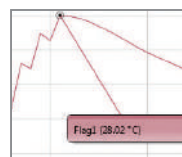
クーリングフラッグ