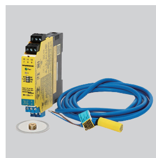
本質安全防爆 バリアシステム