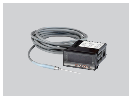
温度センサ 指示計