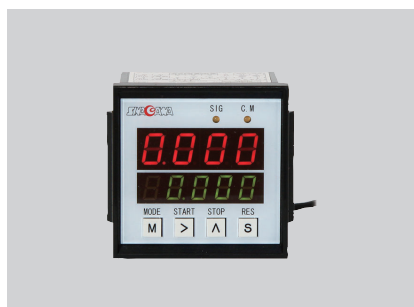
STF デジタルカウンタ