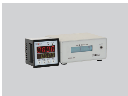
SUS インテリジェントカウンタ